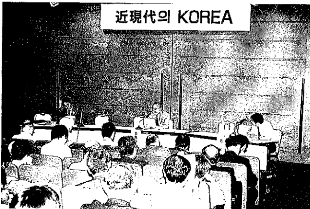
“제5차조선학국제학술토론회” 심포지움의 상황

***** 운영위원회의 개선에 따라서, 본부사무국 운영체제도 아래와 같이 결정되었습니다.